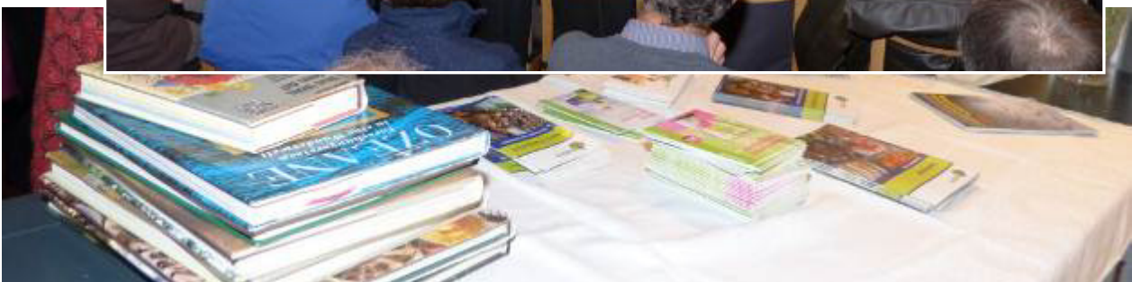
Arbeitskreis Gentechnikfreie Anbauregion Kressbronn, Langenargen u. Tettngang